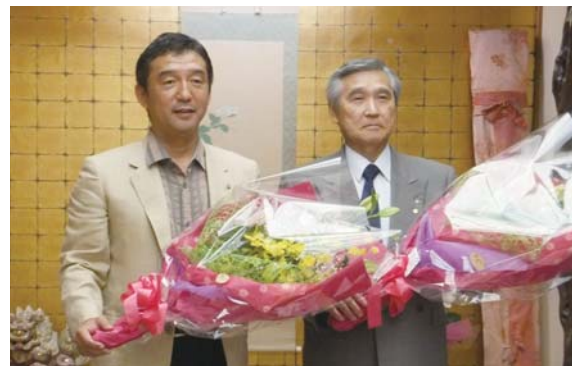
一年間、お疲れさまでした。